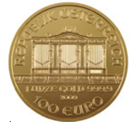
Mehrmals täglich werden die Verkaufspreise den aktuellen Börsenkursen angepasst